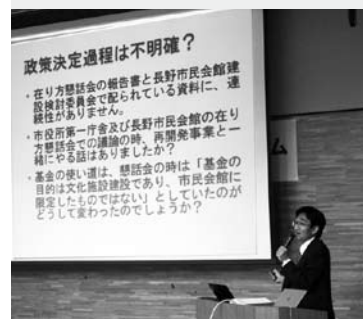
「市民会館建て替えを考える」フォーラムにて